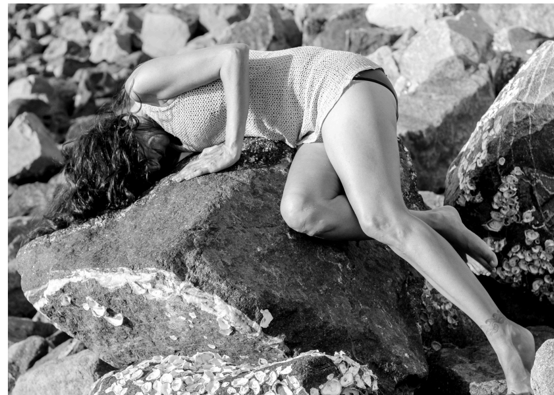
Performance no rio Sergipe. 2025.